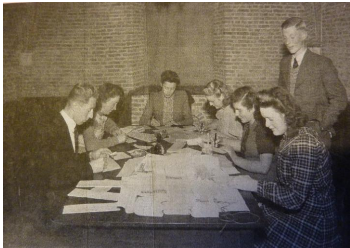
Hier ziet de redactie van 'Van eigen haard' druk bezig om alle kopie te controleren.

In 1946 werden de eerste militairen naar Nederlands-Indië uitgezonden om daar recht en orde te gaan herstellen. Al snel daarna ontstond er in Sprang het idee om de Sprang-Capelse militairen te ondersteunen. Door een aantal betrokkenen is bedacht om voor de jongens in Indië een contactblad te maken. Dat blad had het doel om hen daar geestelijk te ondersteunen. En ze op de hoogte te houden van het nieuws uit Sprang-Capelle. Het blad werd 'Van eigen haard' genoemd en verscheen 2 x per maand. Het blad is opgeheven half 1948.