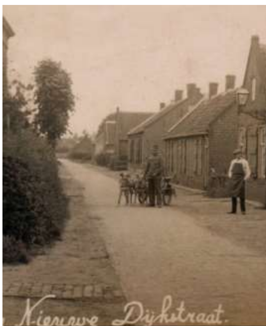
De foto is genomen in de Dijkstraat rond

We krijgen een goed beeld van waar honden allemaal voor gebruikt werden. En dan moeten we ons wel even verplaatsen naar de periode rond 1900.