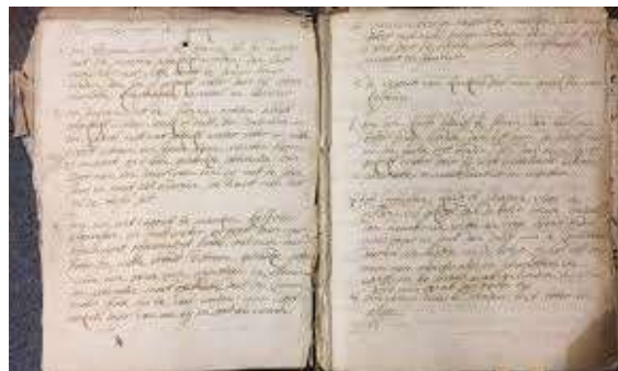
Eén van de onlangs gescande stukken, het receptenboek uit het archief van de doktersfamilie Raupp.