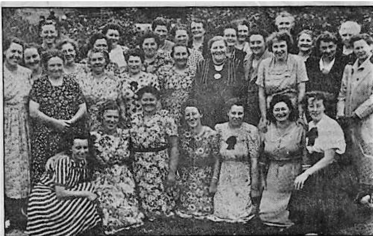
Een groepsfoto van de plattelandsvrouwen tijdens een zomerreis in de beginperiode.

maand een bijeenkomst gehouden, waarin zoveel mogelijk variatie zit. Vaak worden er gastsprekers uitgenodigd, zoals bij voorbeeld