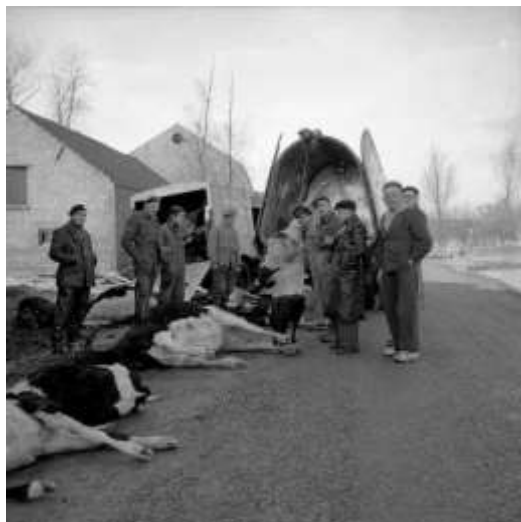
Kadavers op de Waspiksedijk.