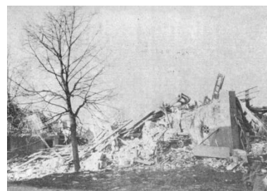
En dit bleef van het raadhuis over nadat het op 22 dec. 1944 door een V-1 werd getroffen