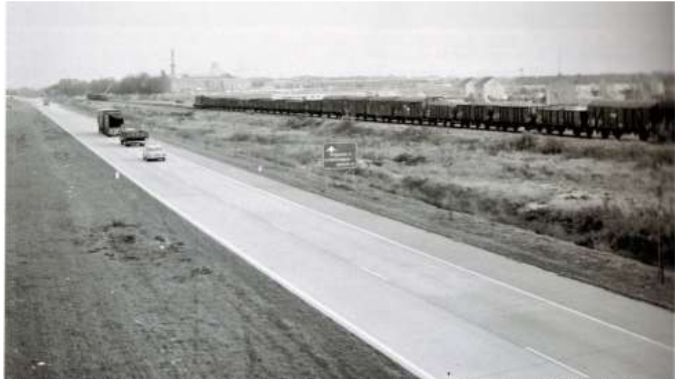
De Langstraatsnelverkeersweg, hier nog enkelbaans, langs Drunen. Foto van rond 1970. Let ook op de Langstraatspoorlijn, toen nog in gebruik voor goederenvervoer. Op de achtergrond de Lips-fabrieken.

Het wordt een langdurig proces waarbij overstromingen maar ook oorlogen de werkzaamheden ernstig vertragen en belemmeren. De Langstraat ontvolkt en verarmt en het zal nog tot 1766 duren voordat het overstromingsprobleem gedeeltelijk zal worden opgelost. Dan wordt de Baardwijkse Overlaat aangelegd, een gebied dat als waterbuffer dient voor al het water dat vanuit Den Bosch het gebied van de Langstraat binnenstroomt. Dit geeft verbetering, maar het blijft behelpen met pontjes en bruggen. In het ergste geval moet men over Giersbergen via Vught naar Den Bosch, en als dat niet kan moet men zelfs over Dongen, Loon op Zand en via Cromvoirt naar Den Bosch reizen. Dit zou nog tot de tweede helft van de negentiende eeuw duren. Als daarna de Bergsche Maas en het Drongelens Kanaal worden gegraven, heeft men geen last van ernstige overstromingen meer. Mede door Napoleon komt in de negentiende eeuw het besef dat goede verbindingen tussen steden en dorpen erg belangrijk zijn, en daarom wordt vanaf 1816 een nationaal wegenplan gemaakt waardoor de Langstraatweg in 1820 een provinciale weg wordt. Vanaf 1849 is de gehele weg bestraat, maar wie zal dat betalen? 1,5 procent wordt van de gemeentes gevraagd maar die voelen er weinig voor. Dus geeft dat vertraging en problemen met onderhoud. Er zal tot 1872 tol geheven worden; daarmee wordt dit 'paardengeld' voorloper van de wegenbelasting.